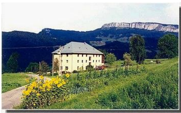
AGLDC La Grénery

AGLDC La Grénery 73670 St Pierre d'Entremont tel 04 79 65 85 18 Coordonnées GPS : 45 45099 / 5 88992