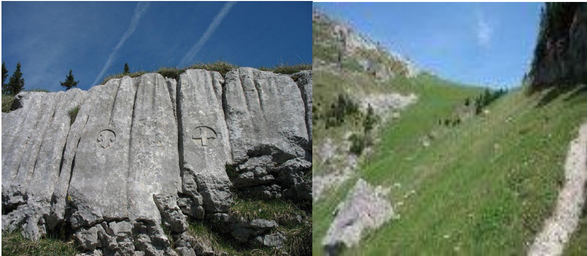
Frontière entre royaume de France et Savoie